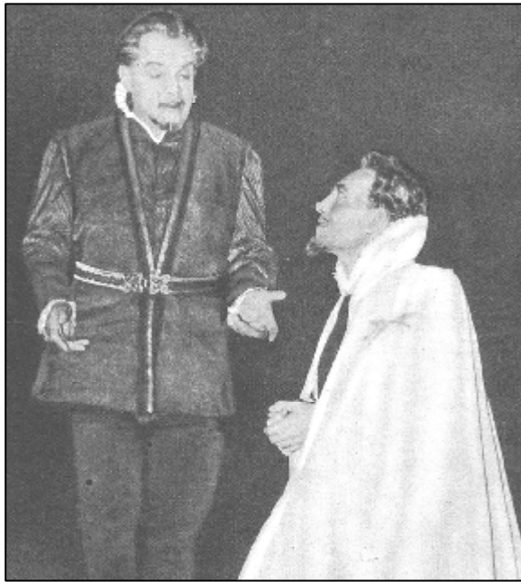
Mathias Wieman i rollen som markis de Posa, der knæler for Walter Franck i rollen som kong Phillip i Friedrich Schillers drama »Don Carlos«, opført ved Ruhrfestspiel 1951.