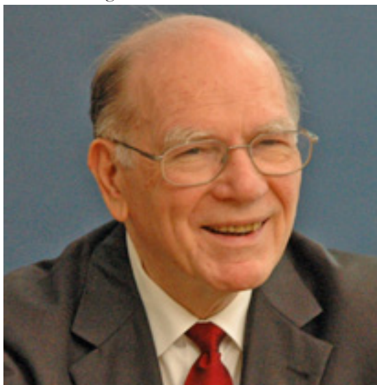
Den amerikanske statsmand Lyndon LaRouche fremlagde forslaget til en 4-magts aftale på Rhodos i efteråret og det blev først fulgt op af et tæt samarbejde mellem Rusland og Kina, og nu mellem Kina og Indien.

Og i kølvandet på den tale, og de mange andre møder der fandt sted på Rhodos, også med ledende kredse fra Rusland, så blev der etableret et nyt samarbejde mellem Rusland og Kina, hvor Kina besluttede sig for at bruge en stor del af deres valutaeserver på opbygning