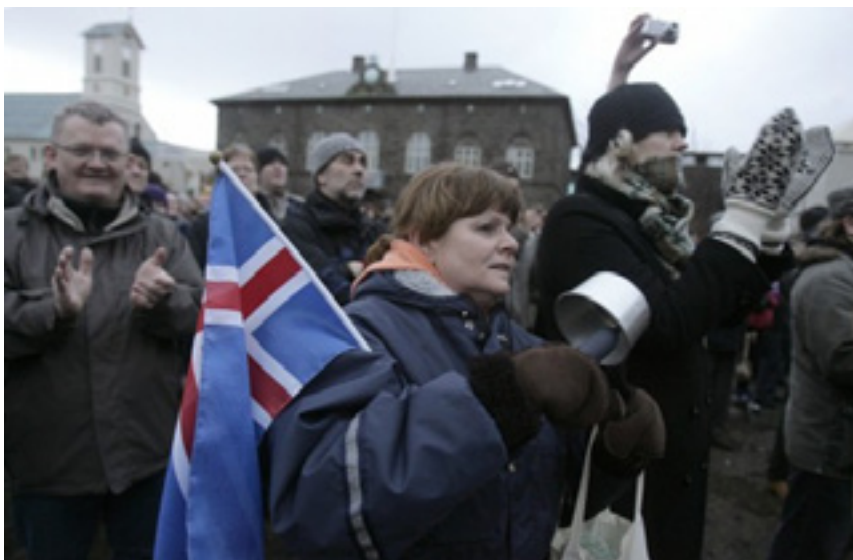
Der er stærke protester fra befolkningen på Island imod at blive gældsatte til evig tid for at dække spekulanternes tab. Skal Island og befolkningens velfærd komme først eller finansverdens? Det spørgsmål gælder ikke bare Island.

Den aftale havde man lavet. Om det sagde England og Holland, »Det er ikke godt nok.« Derfor river vi den i stykker. Vi vil have en ny aftale, og den nye aftale skal i stedet fjerne de her begrænsninger og bare sige, at enhver islænding til evig tid er ansvarlig for at betale gælden tilbage. Men ikke nok med det. Vi lægger en rente på gælden på 5,5%, hvilket er imponerende i forhold til, at diskontoen lige nu er 1%. Det vil sige, at Island aldrig vil kunne betale renterne på gælden. Og så kunne de bare være med til at betale, og betale, og betale i al evighed.