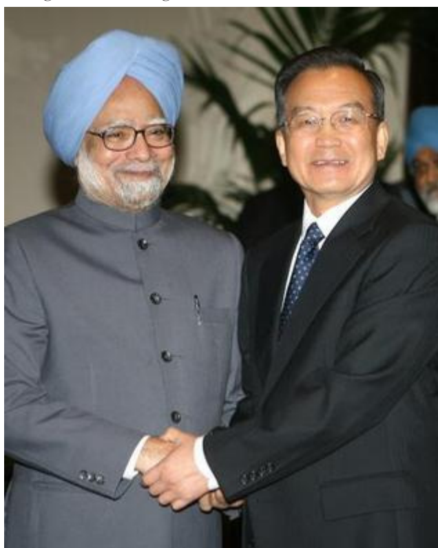
Alliancen mellem verdens to folkerigeste lande holdt stand ved topmødet i København og skabte en ny verdensorden. Her ses Indiens statsminister Manmohan Singh og Kinas statsminister Wen Jiabao på et forberedende klimamøde.

Og det var faktisk delvist, hvad der skete på konferencen i København. Det blev illustreret på topmødet i København, at verdens magtcentrum er flyttet fra Atlanterhavet til Stillehavet. Da den danske statsminister Lars Løkke Rasmussen holdt krisemøde med Barack Obama og alle de europæiske stats- og regeringschefer i de afsluttende timer af konferencen, og man desperat forsøgte at komme op med en aftale, så betød det ingenting, for det forum havde ikke længere nogen magt og indflydelse. Der, hvor det blev afgjort, hvad der ville komme ud af konferencen, det var ved et møde, der fandt sted med Kina, Indien, Brasilien og Sydafrika. Et møde som Obama fik snuset op fandt sted, og hvor han brød ind som en anden Rambo og sagde: »I kan ikke sidde her og have et hemmeligt møde. Jeg vil være med.« Og så satte han sig ned med de fire, og lavede den aftale, som senere blev aftalen fra