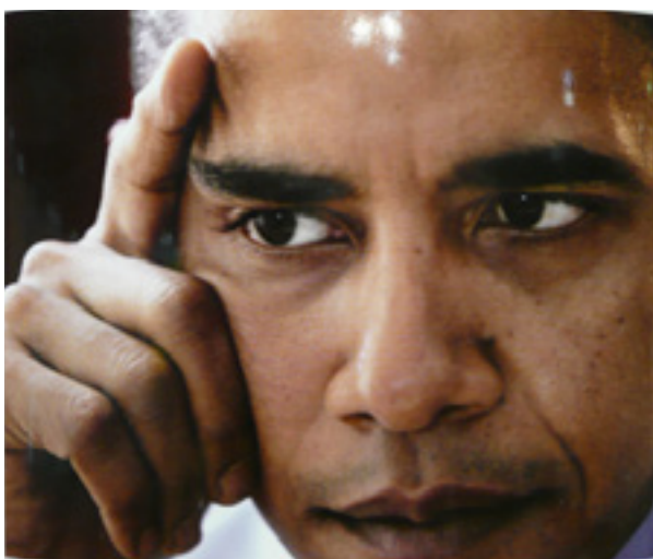
Barack Obamas sundhedsreform vil øge dødeligheden i befolkningen gennem at skære i det offentlige tilskud og reducere behandlingsudbuddet. Man forsøger også at tilsidesætte forfatningen. Vil han stå over for en rigsretssag for forræderi?

Under de forhåndenværende omstændigheder er der blevet fremlagt mere end fuldt ud tilstrækkelige grunde for en rigsretssag imod præsident Barack Obama, i form af summen af hans handlinger og hensigtserklæringer indtil nu.«