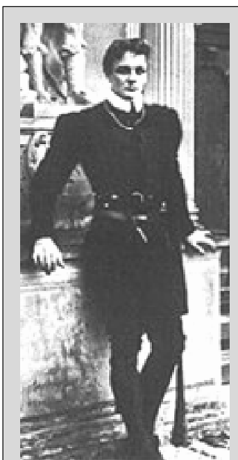
»Alle klassiske tragedier fremstiller et tilfælde, et specifikt historisk tilfælde, hvor et samfund har dømt sig selv til undergang. Og dets udvalgte ledere, hvis meninger stemte overens med samfundets karakterbrist. Hamlet var netop sådan et tilfælde.« (Billede: John Gielgud som Hamlet på Kronborg, 1939.)

overvindes. Det vigtigste er den revolution indenfor religion og kunst, der har givet en forståelse for og indsigt i menneskets historie. Herved har menneskeheden kunnet hæve sig over tidligere niveauer, ved at forhindre den slags fejltagelser, som tidligere fik tragiske konsekvenser.