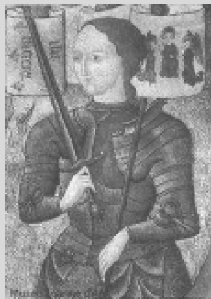
»Det bedste er det ophøjede. Den virkelige, historiske, Jeanne d'Arc er et rigtigt tilfælde af det ophøjede.«