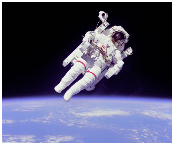
Ifølge den amerikanske statsmand Lyndon LaRouche er Obamas forsøg på at nedlægge det amerikanske rumprogram sammen med hans Hitler-lignende sundhedspolitik lig med forræderi og bør føre til Obamas umiddelbare tilbagetræden eller afsættelse ved en rigsretssag.

Det, Barack Obama gør netop nu, er at afmontere og ødelægge det, der er tilbage af USA. Simpelthen skrotte