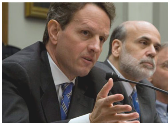
Finansminister Geithner og føderalbankchef Bernanke lyver begge om deres centrale rolle i at overføre 185 mia. dollars til private banker i AIG-skandalen. Hvornår må de gå af?

Og så begynder fortiden og nutiden at blive sammenblandet, for den nuværende finansminister i USA, Timothy