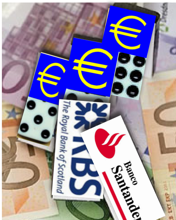
Den græske krise har følgeskab af kriser i Portugal, Irland, Italien og frem for alt Spanien. Det medfører ikke blot fare for euroens sammenbrud, men vil gennem kriser i banker som Banco Santander få store konsekvenser i det internationale finanssystem.

Man skal sørge for at gøre noget i dag, som man om tyve år, om fyrrer år, i næste generation, kan være stolt af, at man har gjort, i stedet for at måtte skamme sig over, at man lod al den opsparrede kultur, al den rigdom som vi har fået her i Europa gennem hundreder af år, falde til jorden og gå i glemmebogen.