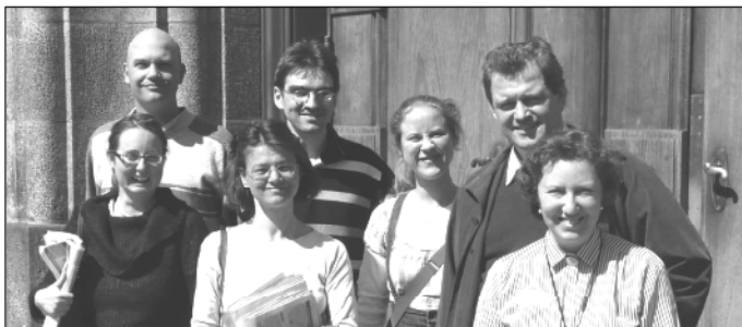
Delegationen fra Schiller Institutet og LaRouches Ungdomsbevægelse efter foretrædet for Folketingets Udenrigsudvalg.